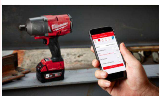
Integrirana sigurnost alata uz ONE-KEY™ aplikaciju sprečava krađu i preinake