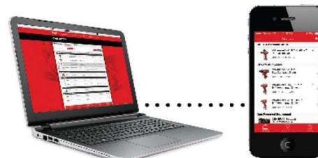
Upravljanje inventarom za organizaciju alata / opreme