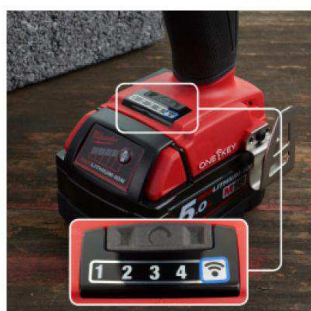
Prilagođavanje alata - podešavanje, izrada i pristup odabranim postavkama