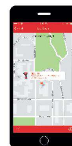
Integrirano praćenje alata identifikira i prikazuje zadnju poznatu lokaciju alata